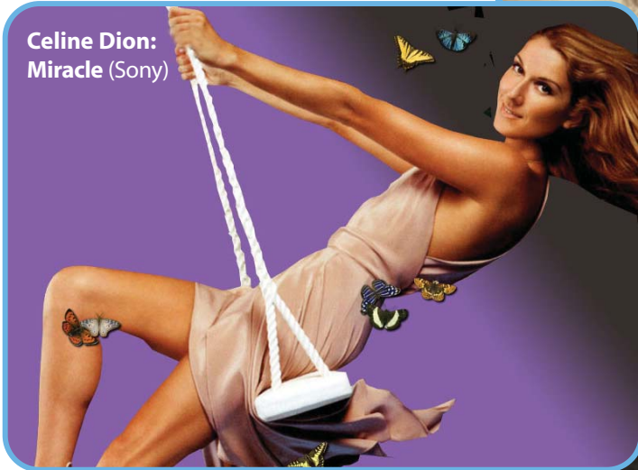
Celine Dion: Miracle (Sony)